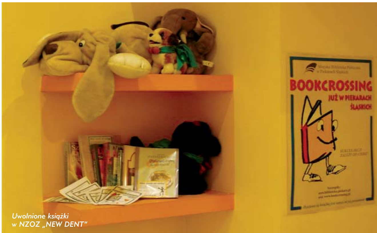
Uwolnione książki w NZOZ „NEW DENT”

książki znalazły swoich nowych czytelników i półki bookcrossingowe świecą pustkami. Przeprowadziliśmy rozmowę z właścicielką restauracji „Fiśła” o akcji uwalniania książek a także o osobistych spostrzeżeniach wynikających z obserwacji półki bookcrossingowej. Ku naszemu miłemu zaskoczeniu Pani stwierdziła, iż miała wrażenie, że wielu klientów przychodziło na „Fiśłę” tylko po to, by zabrać książkę do przeczytania. To nas naprawdę niezmiernie cieszy!