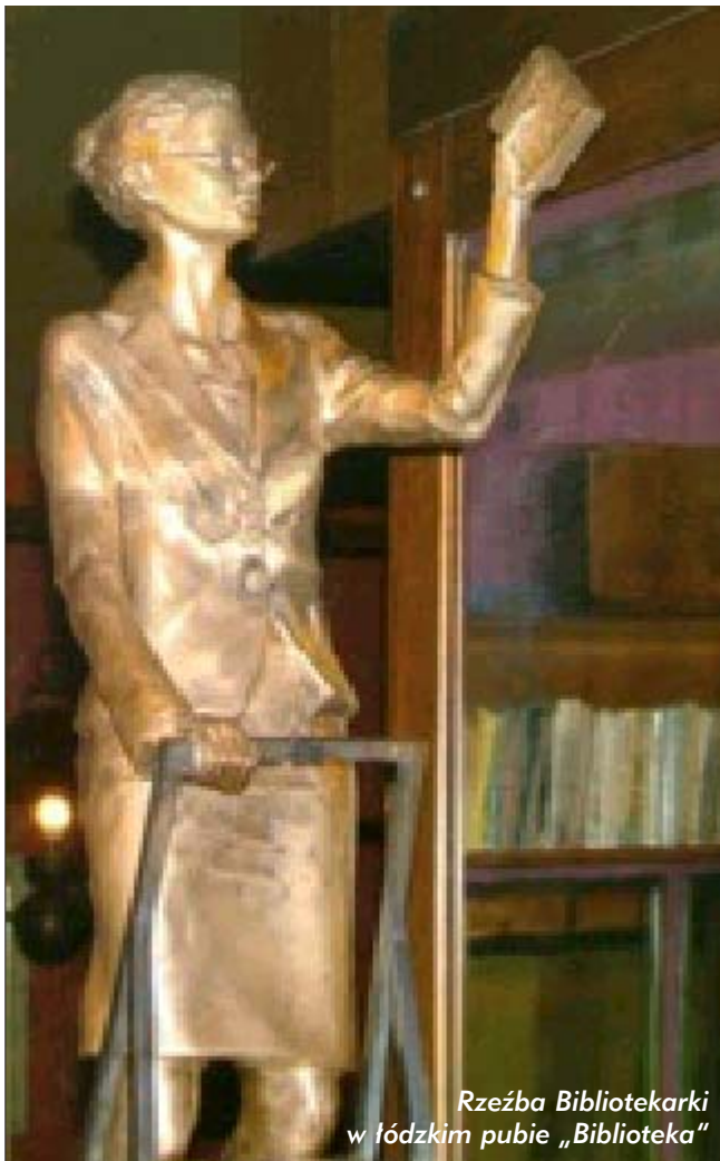
Rzeźba Bibliotekarki w łódzkim pubie „Biblioteka”

Bibliotekarka - zawód wykonywany głównie przez kobiety, osoby wykształcone, odcytane, o tzw. „szerokich horyzontach”, zazwyczaj komunikatywne i otwarte. Praca w bibliotece podobnie jak w instytucjach takich jak szkoła, przedszkole, gabinet lekarski czy bank wymaga od osoby w niej pracującej przestrzegania pewnych norm zarówno związanych z zachowaniem kultury osobistej jak i z wyglądem zewnętrznym. W dzisiejszych cza-