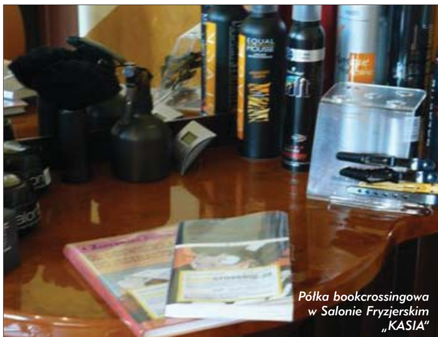
Półka bookcrossingowa w Salonie Fryzjerskim „KASIA”

Rzeczywistość przerosła nasze oczekiwania! A raczej piekarzanie stanęły, jak zwykle na wysokości zadania.