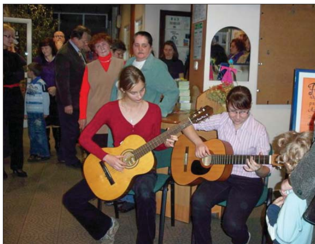
Nasza Biblioteka jest miejscem, w którym każdy znajdzie coś dla siebie

Ważne miejsce w Strategii zajmuje poprawa jakości zbiorów bibliotecznych, podniesienie ich atrakcyjności i aktualności. Zostaną podjęte działania mające na celu zwiększenie zakupu książek do poziomu standardów Międzynarodowej Federacji Stowarzyszeń i Instytucji Bibliotekarskich - IFLA. Oferta biblioteczna zostanie wzbogacona o zbiory pozaksiążkowe.